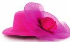
Camilla / hat