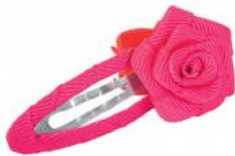
Charlotte / hairclip

Example: It's Charlotte's toy (singulier). They're George's toys (pluriel).