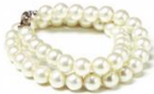
the Queen / pearls